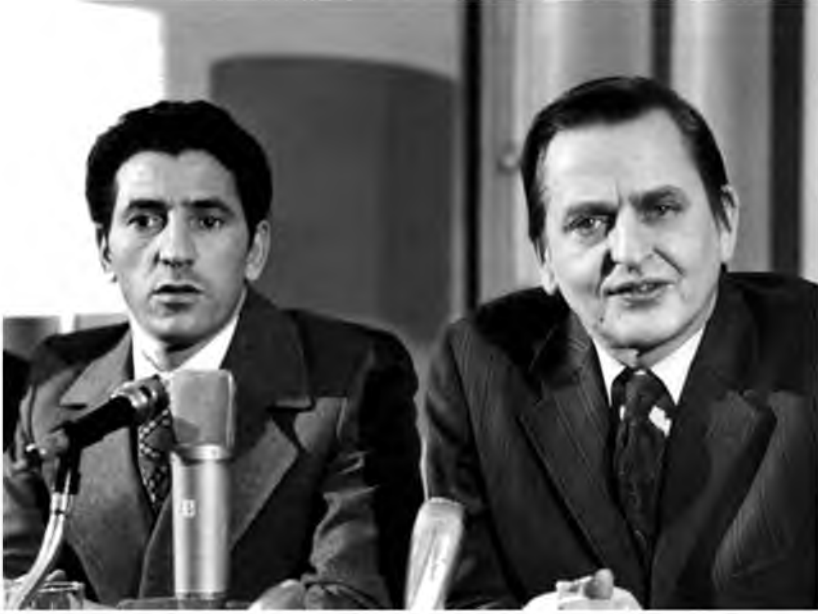
جانب من مؤتمر صحفي بين رئيس وزراء ليبيا عبد السلام جلود ورئيس وزراء السويد أولوف بالمه بعد انتهاء المحادثات بينهما، السويد، 6 / 3 / 1974.